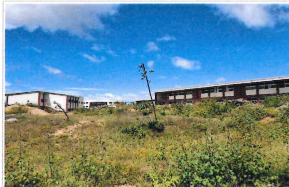
F2- Vista Este - Oeste