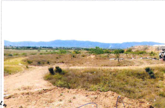
F4- Vista Norte - Sur