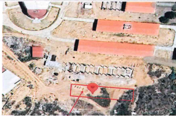
F1- Vista aérea del edificio