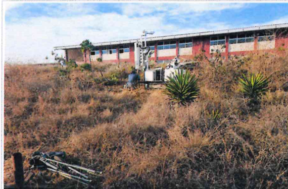
F3- Vista Sur - Norte